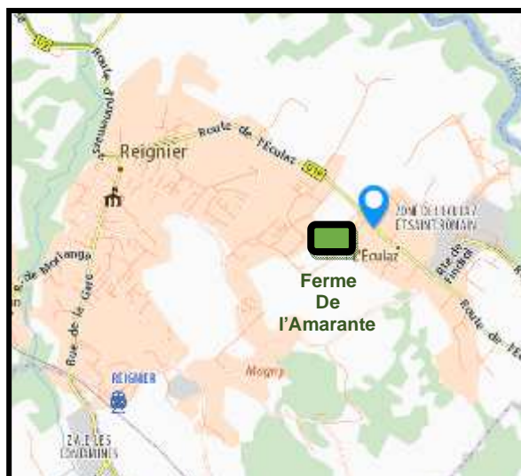
Plan d'accès à la ferme de L'Amarante