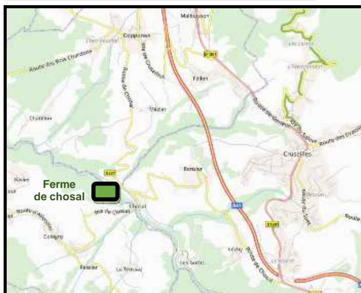
Plan d'accès ferme de Chosal

A HABERE-POCHE, La ferme des Grands Champs propose la fabrication de jus de pommes pasteurisé à partir de vos fruits.