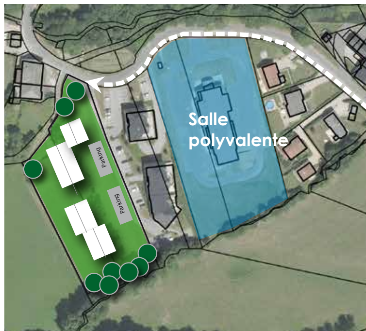
Schéma de principe de composition urbaine, sans valeur réglementaire.